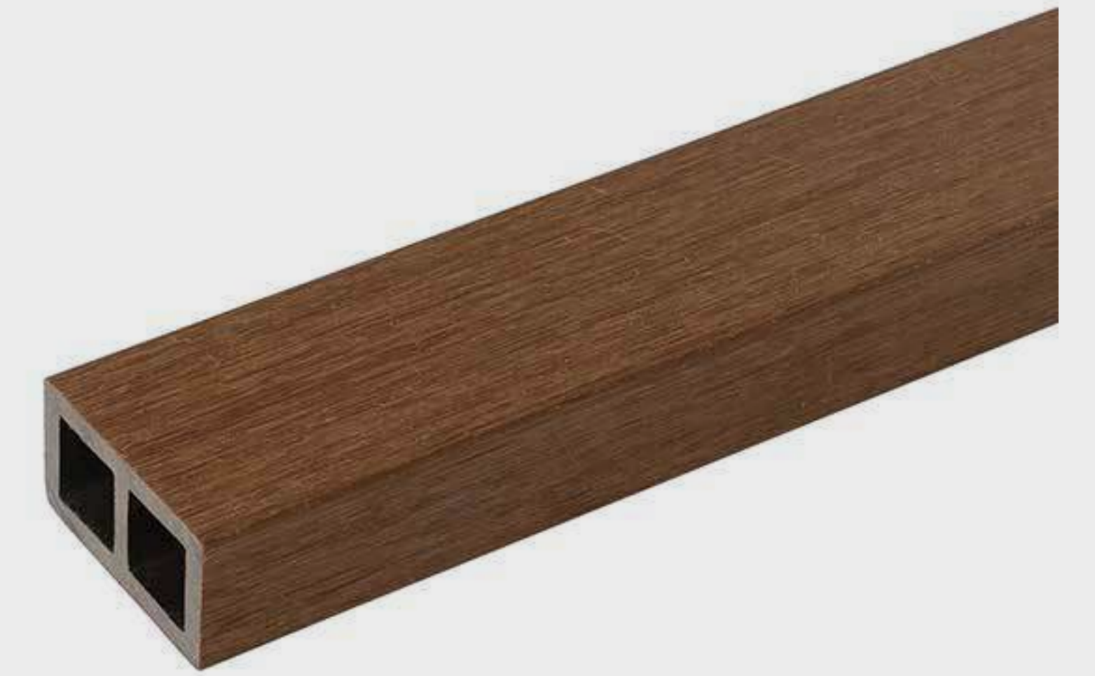
Tabla compuesta de 95% de materiales reciclados de polietileno de alta densidad y fibras de madera. Interior hueco.